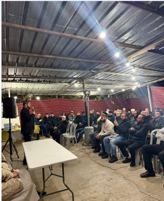
בתמונה: פעילות הפלג הצפוני בלוד.

סולחות בערים המעורבות - במהלך החודש דווח על סולחות שהתקיימו בסכסוכים שונים בערים המעורבות: ביום 11.12 בין משפחות אבו חלאווה ובשבש ביפו. ביום 12.12 בן משפחות חנוני ובטלו ברמלה בהובלת הבורר כרים ג'רושי. וביום 14.12 בין משפחות ארנדס ואבו מוסא מהעיר לוד.