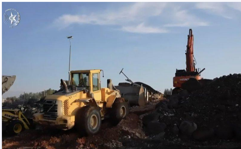
בתמונה: הריסת חומה בטובא זנגריה