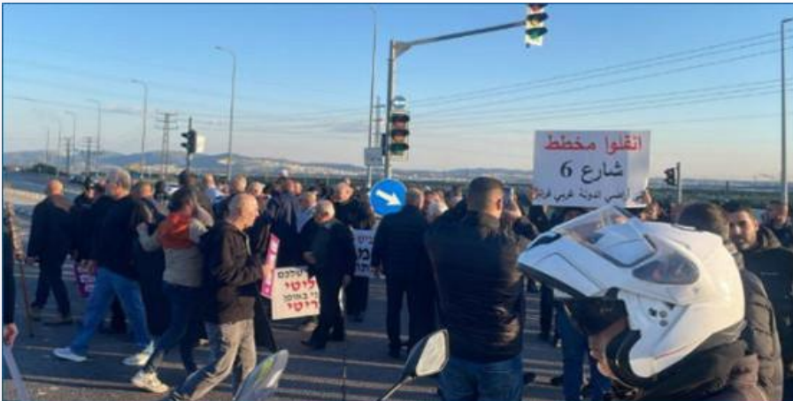
בתמונה: חסימת כבישים בצומת ג'דידה-מכר